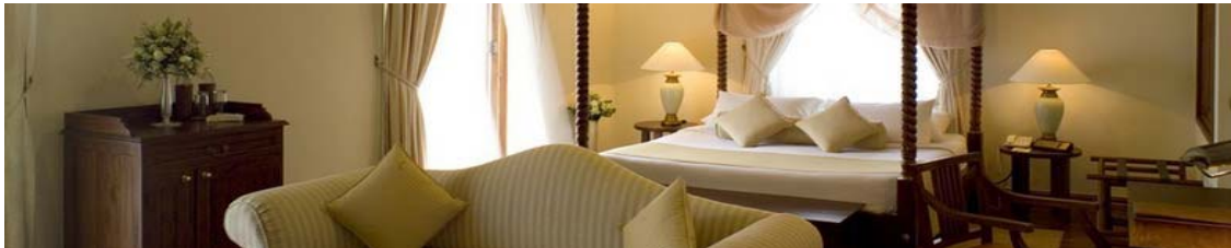
COLOMBO, Hotel Galle Face**** (Regency Wing), 2 Nächte

Ankunft in Colombo. Transfer vom Flughafen zum Hotel. Rest des Tages zur frei Verfügung.