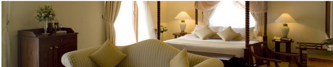
COLOMBO, Hotel Galle Face**** (Regency Wing), 2 Nächte

1.Tag Flug ZÜRICH-DUBAI -COLOMBO 2.Tag COLOMBO