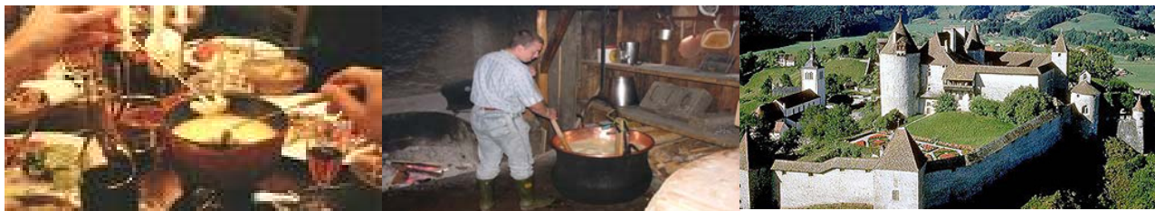
Übernachtung in Gruyeres oder Umgebung

Am Thunersee entlang durch das Simmental und über den malerischen Jaunpass geht es nach Gruyeres. Wir halten unterhalb des Ortes an, ein Fussweg von ca.10 Minuten führt hinauf in das mittelalterliche Städtchen. Man sollte auf keinen Fall versäumen ein typisches Käse-Fondue zu probieren und die grosse Schaukäserei zu besichtigen. BESUCH des Schlosses und Gyger Museums.