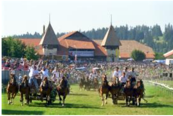
Zweites Wochenende im August

Der Pferdemarkt von Saignelegier mit seinem Pferdewettbewerb wurde zu Beginn des 20. Jahrhunderts mit der Absicht gegründet, die einheimische Rasse der Freiburger Pferde bekanntzumachen und zu fördern. Einst mit einem wichtigen Tiermarkt gekoppelt, wurde die Veranstaltung nach und nach zu einem Pferdefest.